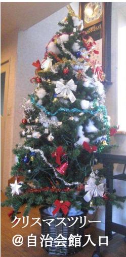
クリスマスツリー @自治会館入口

茶色バンドの婦人用腕時計、黒手袋、黒の婦人用カーデガン、灰色薄セーター 3種類の鍵、灰色帽子、電車おもちゃ 草履形財布(ミニちゃんペンダント付)