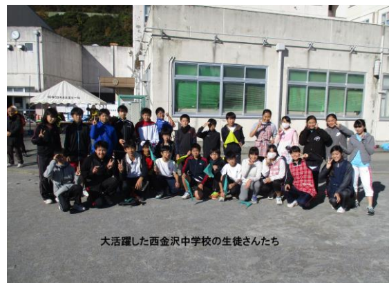
大活躍した西金沢中学校の生徒さんたち

12月5日(土)、3地区連合による地域防災拠点の防災訓練が行われました。地域の参加者は関ヶ谷381名、夏山155名、山の手128名の合計660名で、昨年を150名近く上回りました。防災意識の高まりから、多くの方の参加になったと見られます。当日特に目立ったのが、30名近くが参加した中学生の活躍。力仕事だけでなく、簡易ご飯炊きの実演補助、簡易担架作り、簡易トイレの説明などは多くの参加者から好評を得ました。このほかアマチュア無線協会の方々による災害時対応の説明、防災ボランティアグループの皆さんによるカーバッテリーからの家庭用電力供給の実演などが行われました。