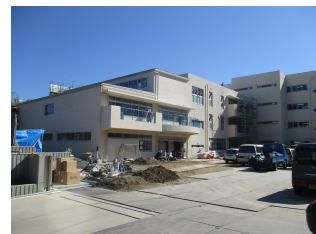
建設が進む新校舎写真

横浜市立釜利谷西小学校と横浜市立西金沢中学校は2010年に横浜市教育委員会により「小中一貫校」に指定され、同年4月から6年間にわたり一貫校としての経験を積んできましたが、本年4月には校舎が一体化されるとともに、校名が「横浜市立義務教育西金沢学園」に変更されます。