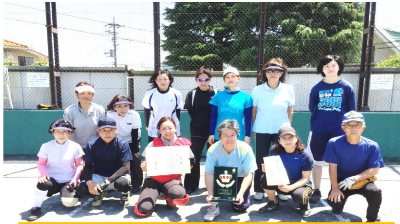
金沢区ソフトボール大会女子一部リーグ準優勝