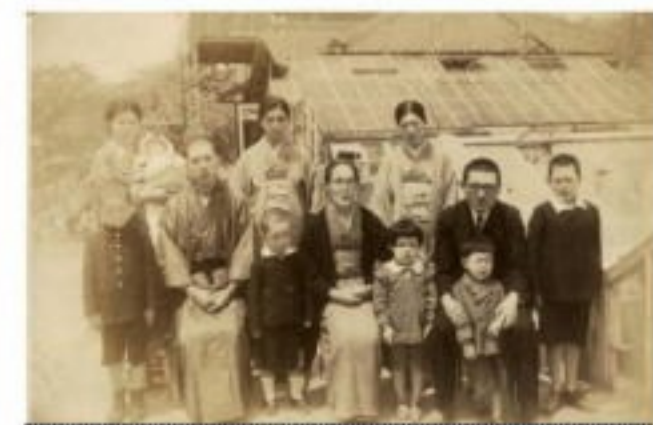
昭和15年頃の家族写真

終戦となり全ての食料・物資が不足する中で米軍によって落とされた「焼夷弾」の残骸は子供達の恰好な遊びに活用されました。子供達は不発弾を見つけて信管を取り外し、火薬に火をつけて遊んだり油脂を燃やしたりして遊ぶというような事をしていました。他にも焼け跡の中から色々な材料を見つけ出し遊びに使っていたのです。幼かった日の思い出です。 中込