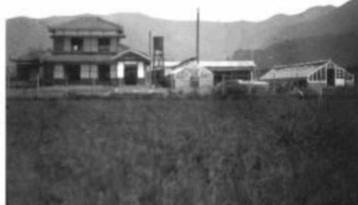
終戦前の生家の全景 (現在は撤去されセブンイレブンとなっている)

私の生家は甲府駅北側武田神社の参道沿いで、当時山梨師範学校(現山梨大学)の東側にありました。父は昭和3年中巨摩郡飯野村(現南アルプス市)から移り住み、露地栽培の花弁類や温室で西洋蘭やサボテン類、メロン・葡萄などを栽培していました。しかし、父は私が4歳の時(日本が真珠湾攻撃した翌年8月)に病死し、母が一人で3男1女を育てながら父の仕事を引き継ぎました。参道は今ほど広くなく道の両側の桜並木は見事なトンネルを作っていて、武田神社祭典の4月12日には沢山の参拝者で賑わっていました。我が家では参拝帰りの人たちに露地植えの花を買って頂くので一番多忙な時期だったのです。