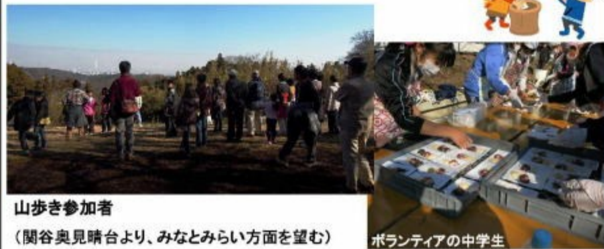
山歩き参加者 (関ヶ谷奥見晴台より、みなとみらい方面を望む)