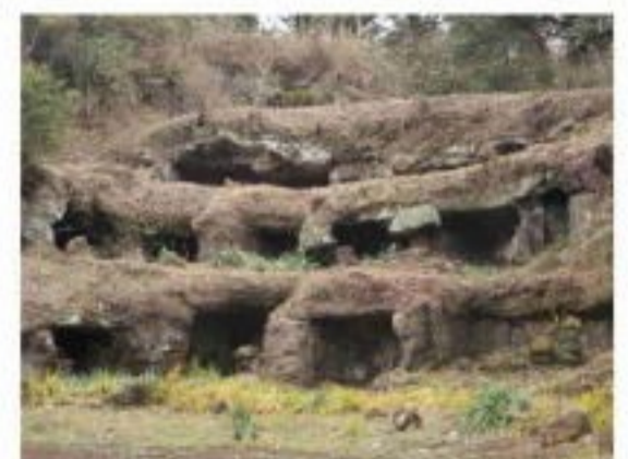
まんだら堂 やぐら群