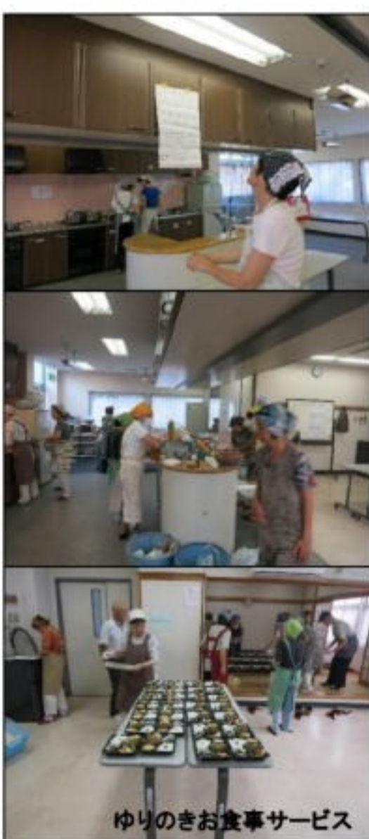
ゆりのきお食事サービス

会報「ふれあい」186号を目にすると、「ゆりのきお食事サービスの会」解散の文字。20数年にわたり地域のお年寄りに美味しいお弁当を届けて頂きました。当初の活動を立ち上げて下さった方々と、それをサイドから応援して下さった方々の熱意とお力に感謝の意を表したくペンを執りました。 思えば、季節の旬の食材を中心に美味しくしかも栄養のバランスにも配慮した見た目にも美しいお弁当を届けて下さいました。廉価でゆりのきお食事サービスの方々の温かい愛情までいっぱい詰まったお弁当と聞いております。民生委員の方やボランティアの方との連携協働も得ながら届くお弁当に大勢の方が到着を待っておられたことでしょう。 20数年に亘って地域の方々で作るお弁当は、他では真似のできない自慢の活動であり配食サービスでありました。コンビニでもスーパーでもいくらかでも安価で手頃なものは売っています。手間は時間も惜しまず、安心していただけるお弁当は、お食事サービスの方々の経験と知恵・工夫そのものでした。想像するに、献立の決定、食材の買い出し・調理・配食・配達とどれ程の話し合いと手間と時間がかかったのか。何回かの話し合い・作業分担があったことでしょう。細かいことを言えば、後片付けや衛生面での配慮も相当大きかったことと推察します。