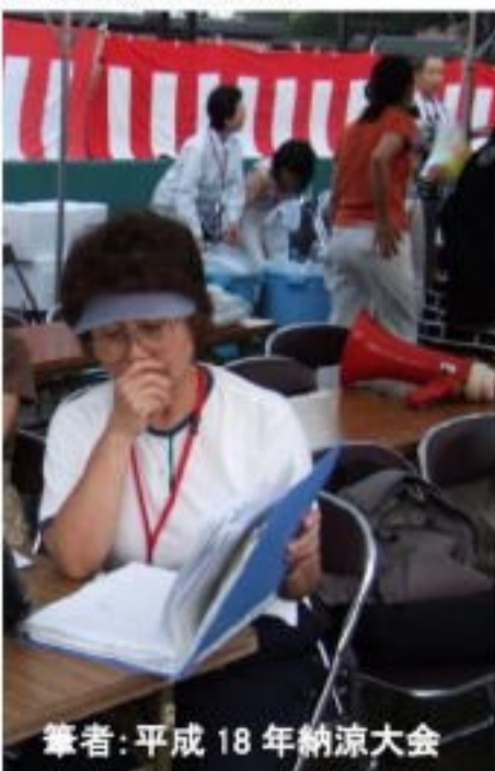
筆者:平成18年納涼大会

10年前、「ゆりのきお食事サービスの会」のお手伝いをしてみたいと数名の方とコミュニティーの厨房を見学させて頂いたことがありました。5・6名の方が作業分担宜しく、手際良く張りつめた空気の中で黙々と仕事をなさり、声を掛けるような雰囲気ではとてもありませんでした。見学の後半そろそろ出来上がるという時に、12月から1月だったので「おなます」と出来立ての「あんころ餅」をご馳走してくださいました。おなますの三倍酢と大根と見事な千切りの人参の鮮やかな色合いと酢が程よく調和して、まさしくお正月という気分になりました。 7月で解散ということですが、どうぞお元気で過ごしてくださいませ。最後になりましたが、今日までの「ゆりのきお食事サービスの会」の活動に心より感謝もうしあげます。野呂