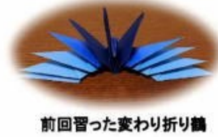
前回習った変わり折り鶴