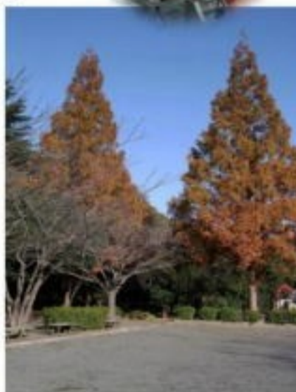
(メタセコイア 草舞台公園)