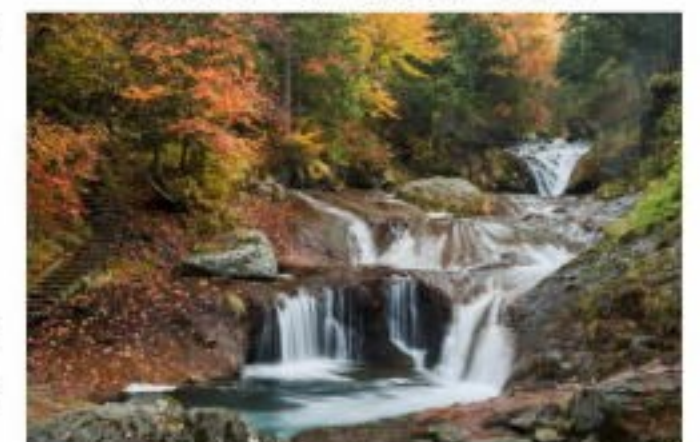
おしどり隠しの滝