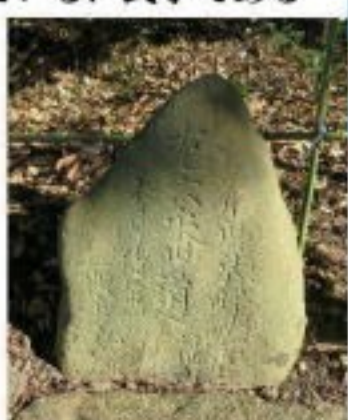
↑ ④ 句碑 ← ⑤ 道標

年末年始の賑わいが一段落した今、散歩などの機会に足を運んでみてはいかがでしょうか。 栗林