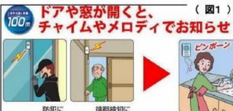
今回のものは(図1)「ドア窓送信機と受信チャイム」のセット。このほかに人感センサー方式の商品もある

窓からの侵入への防犯対策として二重錠(補助錠)などの錠対策、ガラスの破損対策(防犯ガラスや防犯フィルムなど)に加えて窓の開閉を感知して警報音を発生させる(商品名「ドア窓チャイム」)装置の取り付けをお手伝いしました。