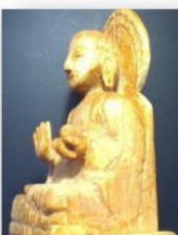
制作途中の薬師如来座像